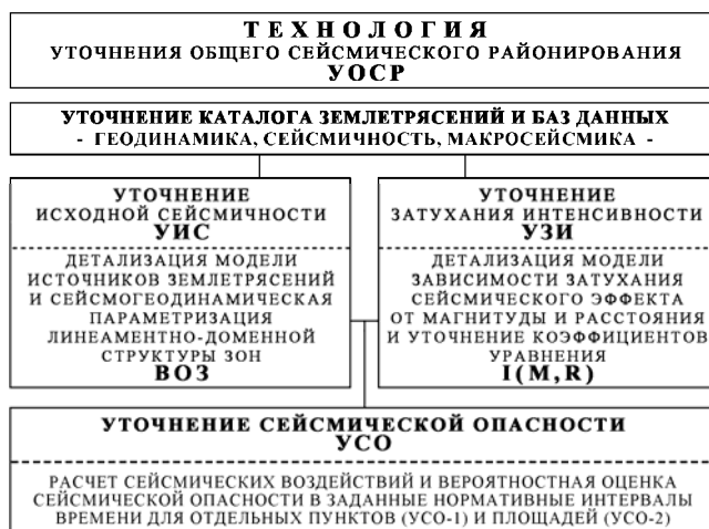
Рис. 2. Схема уточнения сейсмической опасности и карт ОСР.

В 2009 г. нами начата модернизация программно-математического обеспечения (ПМО) «ВОСТОК», представляющего удобный пользовательский интерфейс для задания, редактирования и параметризации зон возникновения очагов землетрясений, расчета повторяемости сейсмического эффекта и оценки сейсмической опасности для построения карт ОСР-2012, для визуализации всех картографических и других входных, промежуточных и выходных данных. На рис. 2 приведена блок-диаграмма технологии уточнения ОСР и некоторой терминологии.